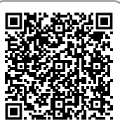
Товары для ванны